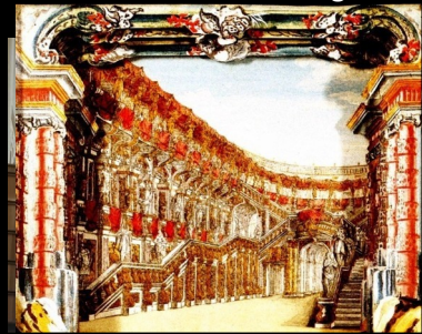
Histoire du théâtre