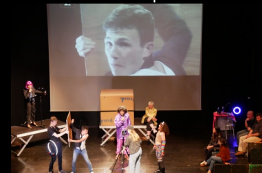
Mise en scène