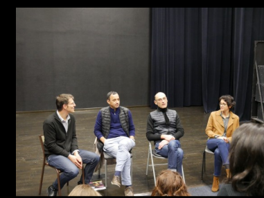
Rencontres avec les équipes

La formation inclut un ensemble de spectacles (environ 20) et qui sont l'occasion de rencontres avec les équipes, d'écritures critiques, etc.. Et aussi des approches renouvelées du théâtre : interviews, médiation, conférences, recherches en archives théâtrales.