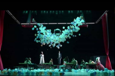
Analyse de spectacles