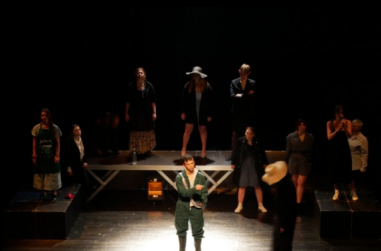
Projets de création